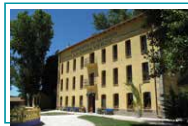
ALMEIDA LA DAMA VERDE