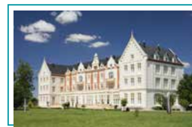
PALACIO DE LAS SALINAS