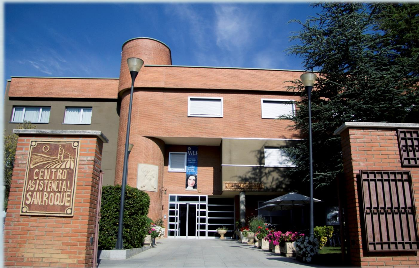
Centro Asistencial San Roque Villalón de Campos (Valladolid)