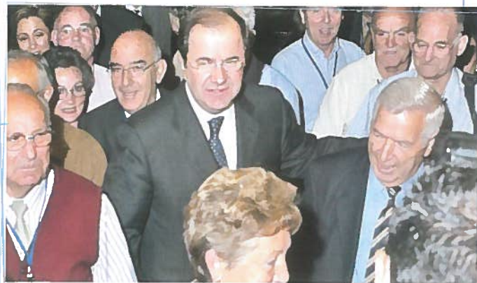
En el centro, el Presidente de la Junta con numerosos asistentes.

Castilla y León es, en la actualidad, la Comunidad más envejecida de toda España y en la que más recursos se dedican al bienestar de las personas mayores. Las ponencias presentadas en el Congreso constataron que el desarrollo de los servicios sociales para atender con calidad a las personas en situación de