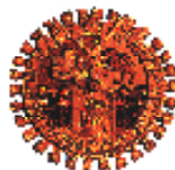
Un v rs S I m ó n B o l í v a r